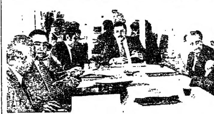
مشهد من اجتماع لجنة العمال والشؤون الاجتماعية .

وقد تداولت اللجنة بمشروع القوانين الثلاثة المتعلقة بالصندوق الوطني للضمان الاجتماعي ، والصلاحيات التي يطالبها الصندوق من اجل تحصيل المبالغ المترتبة على المشتركين من صحتهم وبمؤسسات . وقد رفضت اللجنة طلب الحكومة ، من خلال مشروع القانون الموحد الذي يرمي الى تحديد اصول تحصيل الاموال القائمة لصندوق الضمان الاجتماعي ، وقد ورد في المادة الاولى البنية على الصفحة 12 .